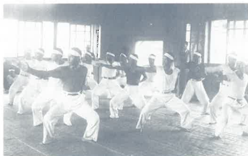
沖縄県師範学校生徒(1932年)