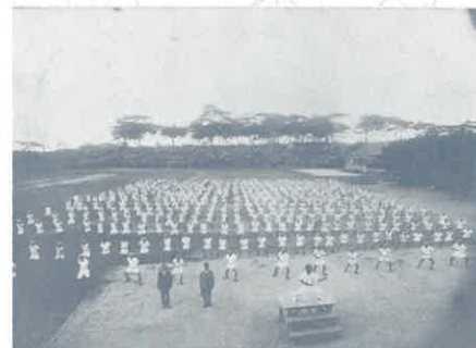
沖縄県立第二中学校全校生徒の集団練習(『空手道大観』(1938年)掲載)