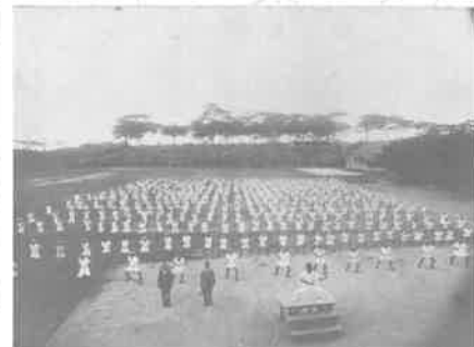
沖縄県立第二中学校全校生徒の集団練習(『空手道大観』(1938年)掲載)