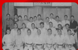
(京都帝国大学／昭和17年撮影)