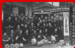
(同志社大学／昭和17年撮影)