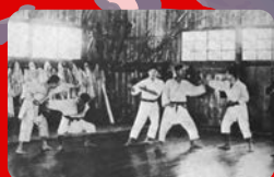
(東京帝国大学／大正15年撮影)