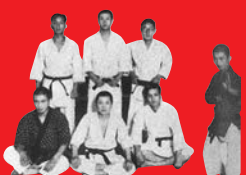
(東洋大学／昭和16年撮影)