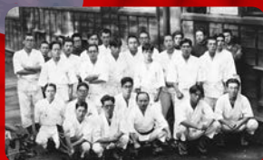
(早稲田大学／昭和7年撮影)