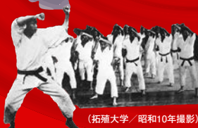
(拓殖大学／昭和10年撮影)