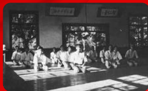
(明治大学／昭和13年撮影)