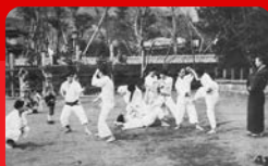
(法政大学／昭和11年撮影)