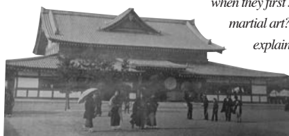
(明治32年に落成した京都武徳殿) Construction of Kyoto Butokuden was completed in 1899.

when they first saw karate, the new martial art? The exhibition will explain the social situation and the attraction to karate from student's perspective during that time.