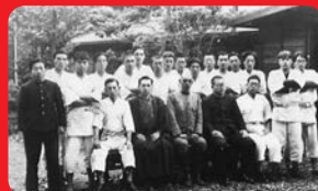
(東京農業大学／昭和10年撮影)