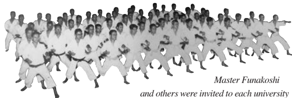
Master Funakoshi and others were invited to each university to help establish the karate clubs.

During the Taisho Era, the Ministry of Education promoted Athletic Physical Education in order to improve the health of people. One of the events held was the "Athletic Physical Education Exhibition" which took place at the Tokyo Museum in 1922. There, Gichin Funakoshi from Okinawa introduced karate, which triggered the spread of karate to domestic universities.