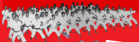
(慶應義塾大学／昭和6年撮影)