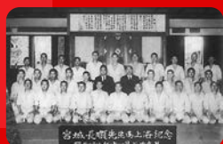
(立命館大学／昭和17年撮影)